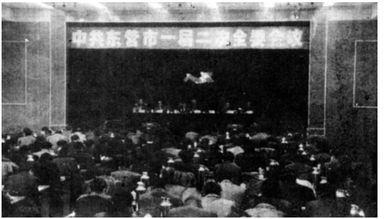
图为中共东营市一届二次全委会会场。